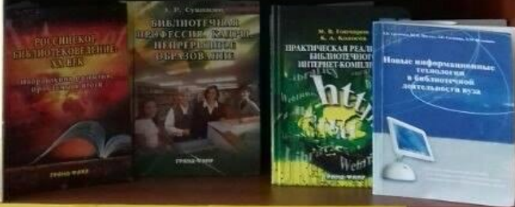
ИНФОРМАЦИОННЫЕ ТЕХНОЛОГИИ В БИБЛИОТЕКЕ ВУЗА