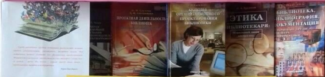
БИБЛИОТЕЧНАЯ ДЕЯТЕЛЬНОСТЬ: ИСТОРИЯ И СОВРЕМЕННОСТЬ